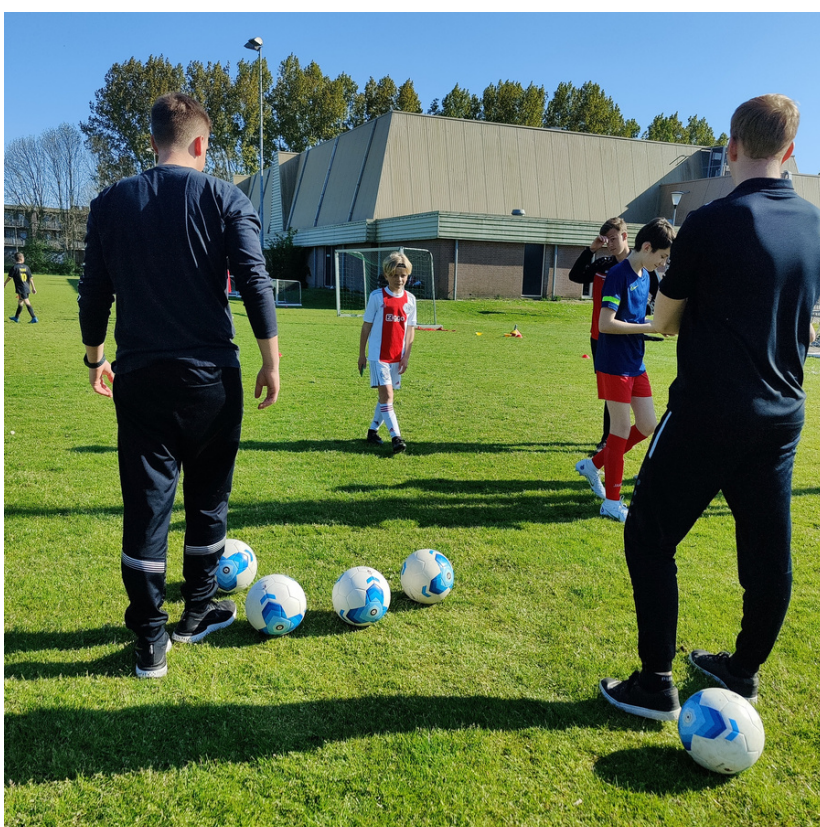
Techspierie Tour Stop bij E.V.C. Edam