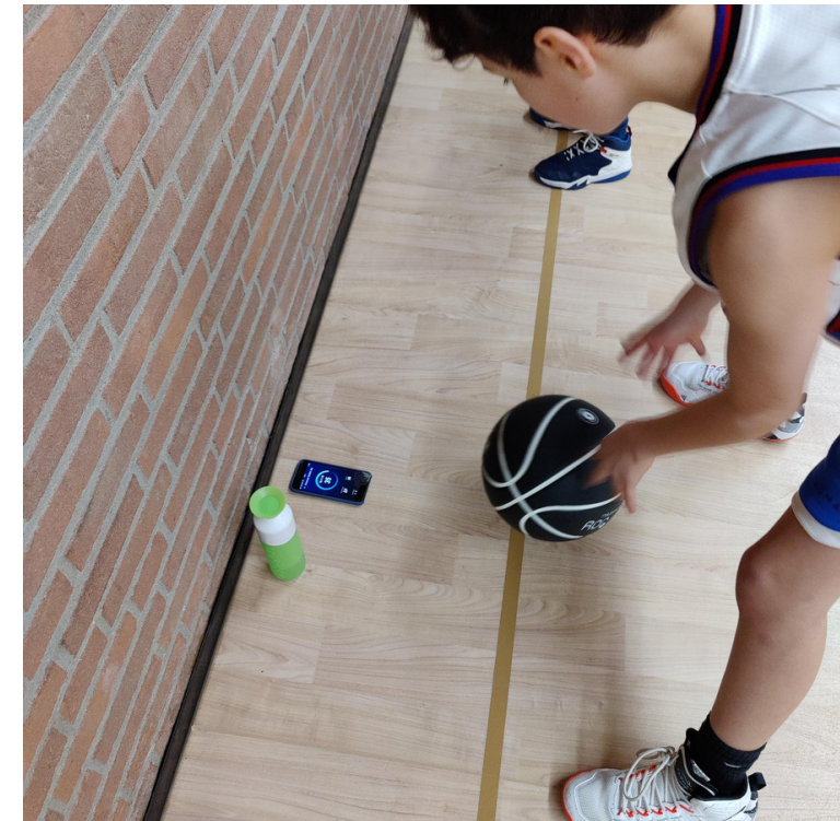
Techspierie Tour Stop bij Utrecht Basketball