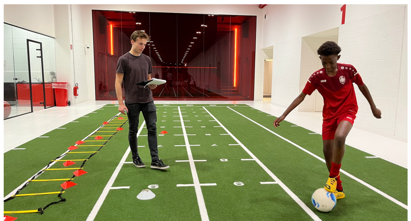
INSAIT JOY Ball Controle Test bij Royal Antwerp FC